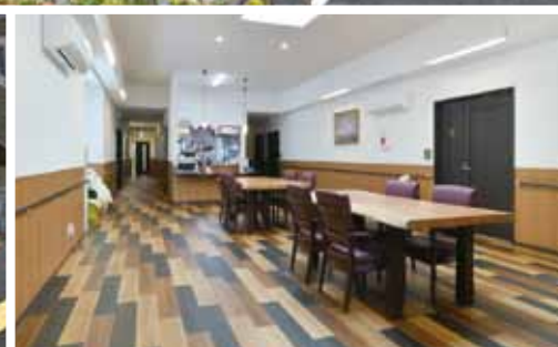
(※写真はファミリー・ホスピス成瀬ハウス)